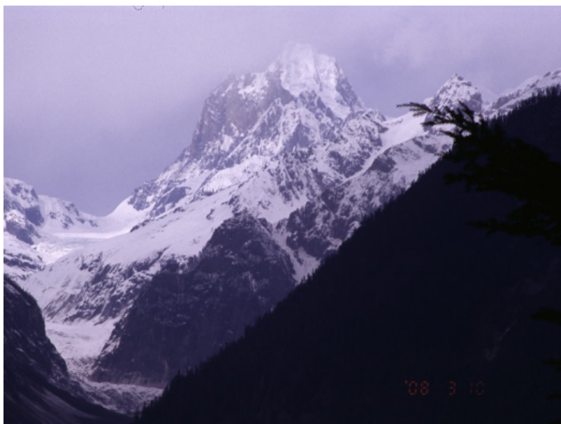
①ジアンプ氷河の未踏峰6694m峰南壁