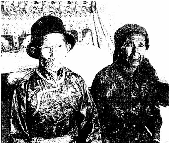
1930年代にモンゴル人民共和国から逃亡してきた兄と、その後エゼネ旗で産まれた妹