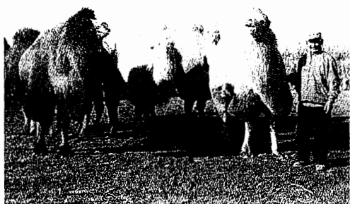
かつてはラクダによって 国境を越える交易がおこなわれた