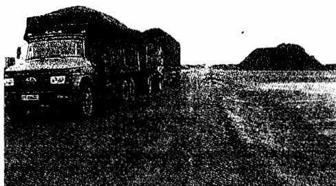
石炭を積載したトラックと、モンゴル国から運び込まれた石炭の山