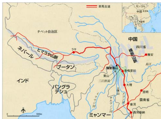
茶馬古道ルート図