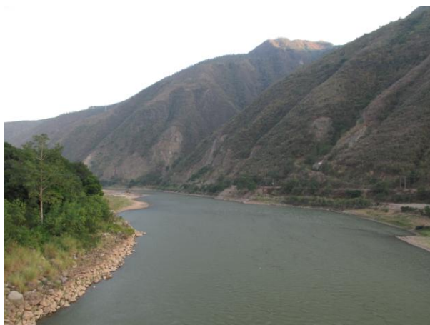
南沙大橋からみた紅河 (下流方向)