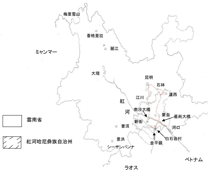
第7回雲南懇話会フィールドワーク行程図

その中で、紅河、元陽県哈尼族の棚田、金平県瑶族のゴム林についての感想と疑問（聞き逃したこと）を纏めてみた。