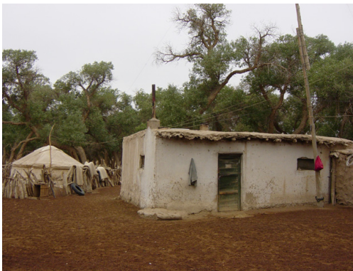
写真1 ポプラの中に暮らす牧畜民の住居（2003年8月撮影）

みる 1936年から37年にエゼネ旗に滞在した日本人の満洲航空社員の資料によると、当時の総人口1040人のうち、約4割に相当する380人が外モンゴル（＝モンゴル人民共和国、現モンゴル国）出身であった 6) 。というのは、1930年代、多くの人が革命後の宗教弾圧を逃れて中国へ亡命し