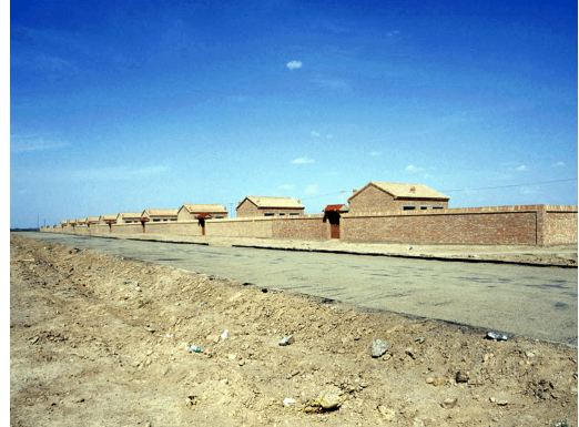
写真4 移民村（2003年9月撮影）