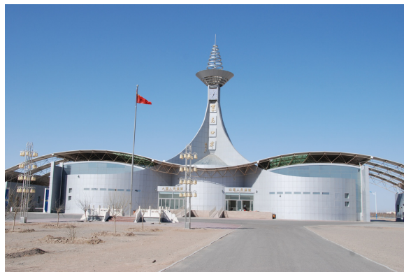
写真5 国境の新しい窓口（2009年3月撮影）