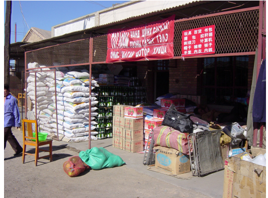
写真2 エゼネ旗の国境沿いの街。さまざまな日用品が並べられている。(2003年9月撮影)