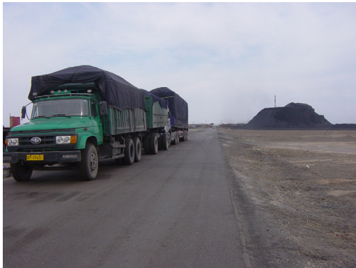
写真3 モンゴル国から運び込まれて山積みになった石炭（右奥）。石炭を積載したトラックが連なる。(2006年9月撮影)